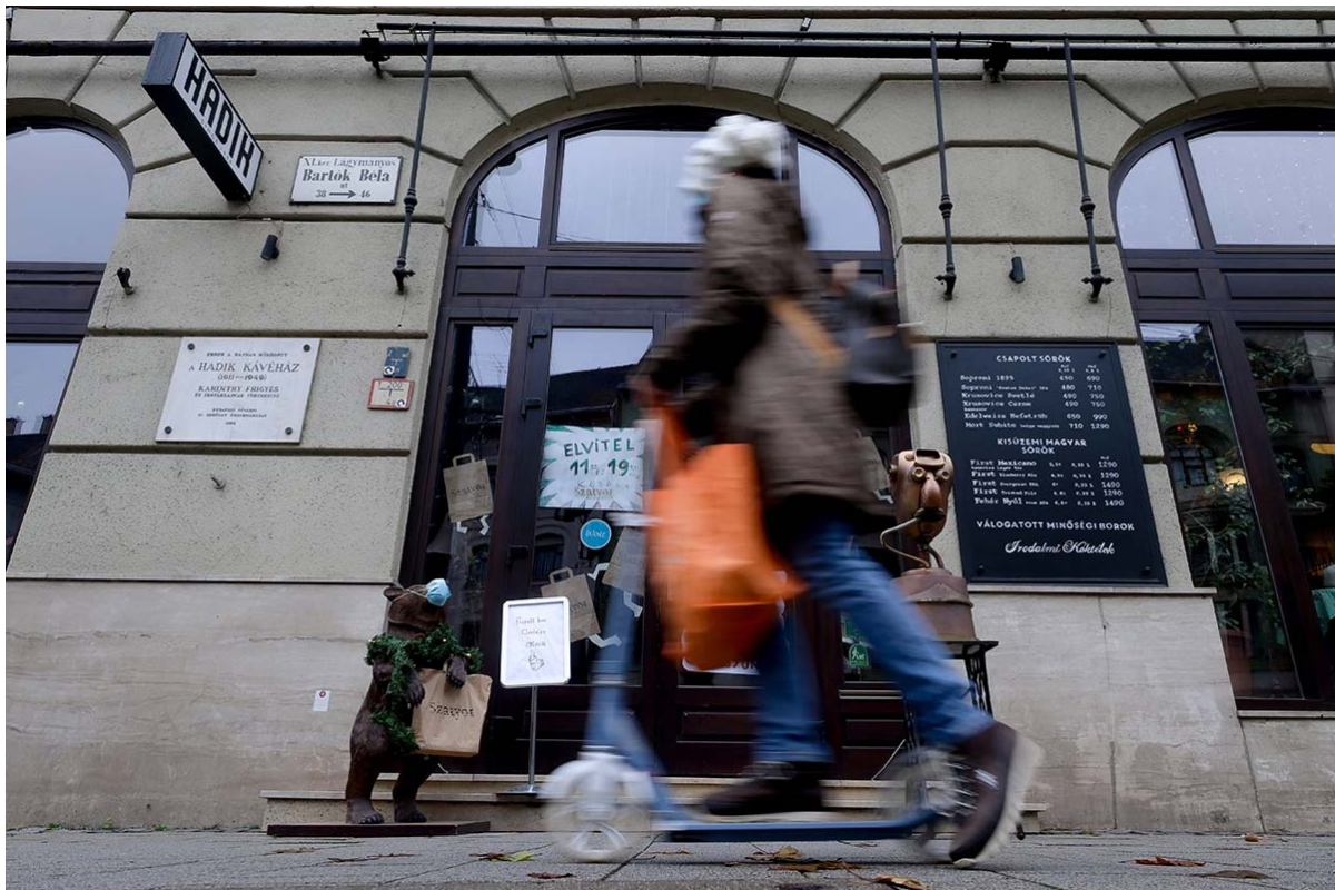
Koszticsák Szilárd / MTI

Ráadásul a koronavírus széthúzta a társadalmi ollót, a társadalmi költségek elképzelhetetlenül nagyok.