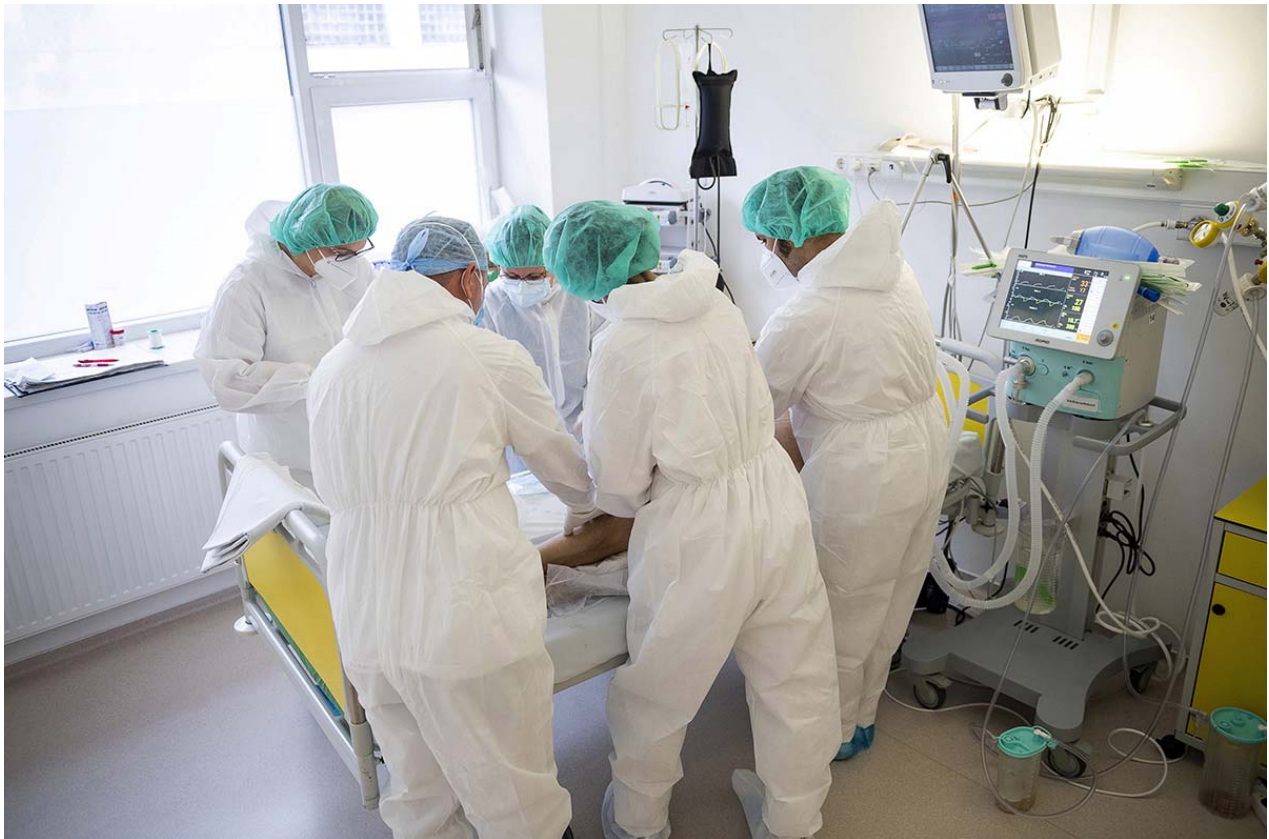
Ápolók látnak el egy beteget a Jóna András Oktatókórház Covid-intenzív osztályán Nyíregyházán 2020. november 25-én.

Szinte állandó hadiállapot van, pedig senki nem fenyeget minket. Emellett nem folynak érdemi, szakmai viták, amelyekben felmerülhetnének olyan kérdések, hogy miért kell milliárdos csapatszállító gépeket venni, miért kell méregdrága légvédelmi elhárító rendszer, miért kell több tízezer lélegeztetőgép, amikor személyzet biztosan nem lesz hozzá. Ugyanígy nem esik szó gazdaságvédelmi súlypontokról, a nagyrészt a klientúrának adott milliárdos támogatásokról vagy a felsőoktatás helyzetéről.